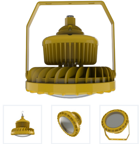
Photo(s) non contractuelle(s). L'apparence du produit peut être amenée à être modifiée.