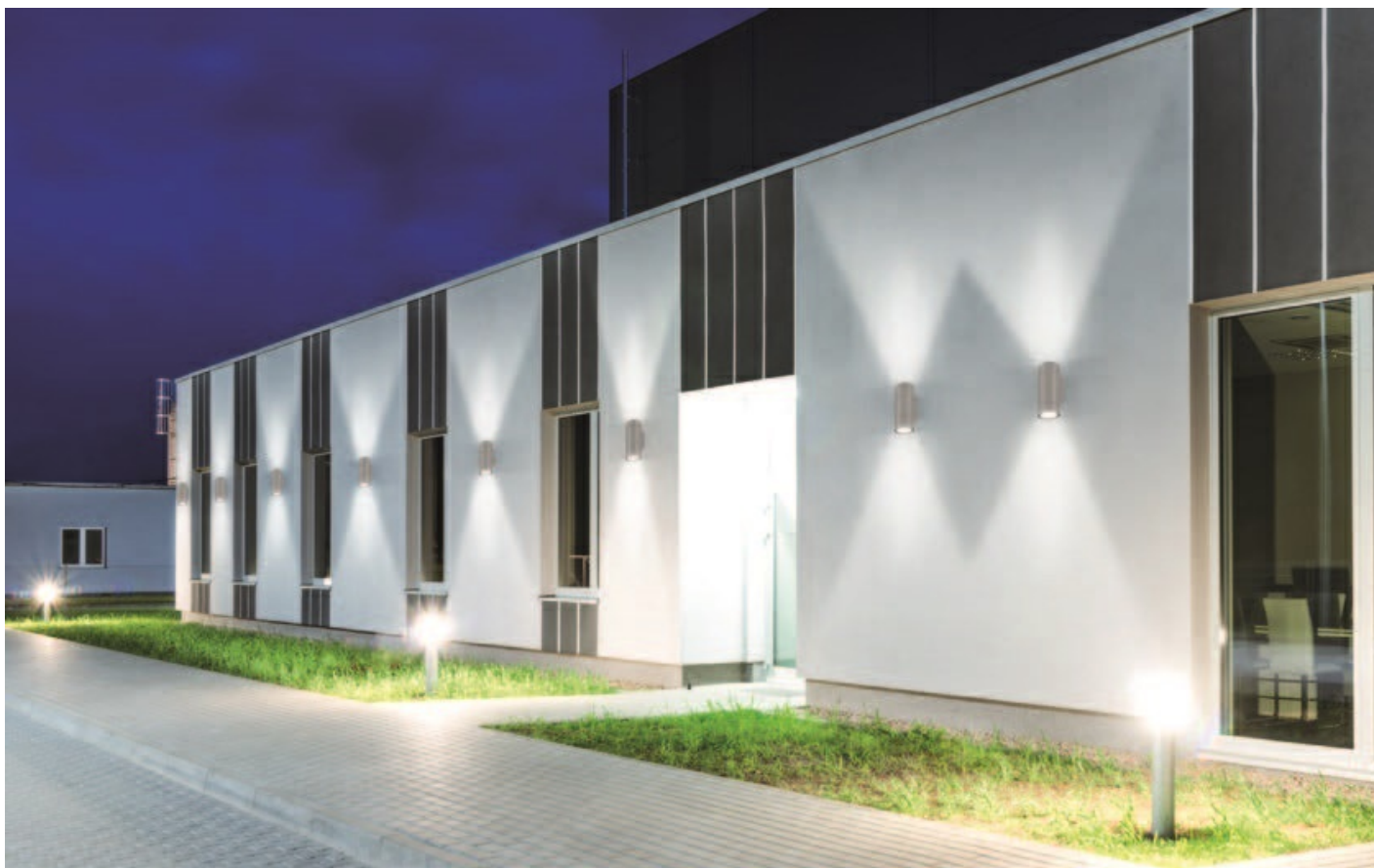
Photo de mise en situation