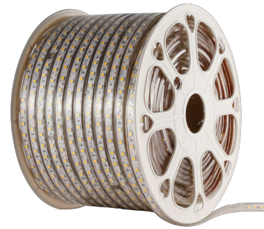
Photo(s) non contractuelle(s). L'apparence du produit peut être amenée à être modifiée.