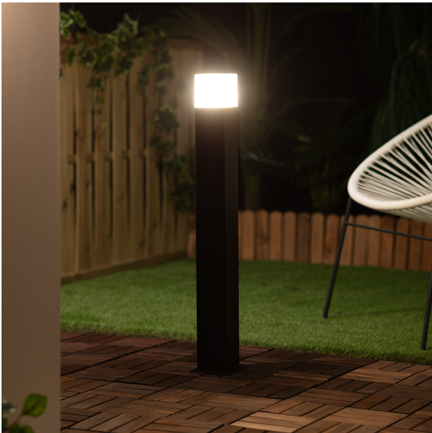
Photo de mise en situation