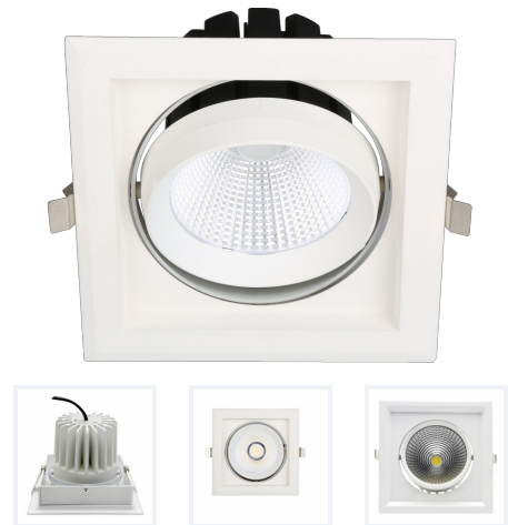
Photo(s) non contractuelle(s). L'apparence du produit peut être amenée à être modifiée.