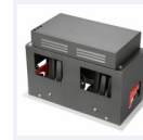
Photo(s) non contractuelle(s). L'apparence du produit peut être amenée à être modifiée.