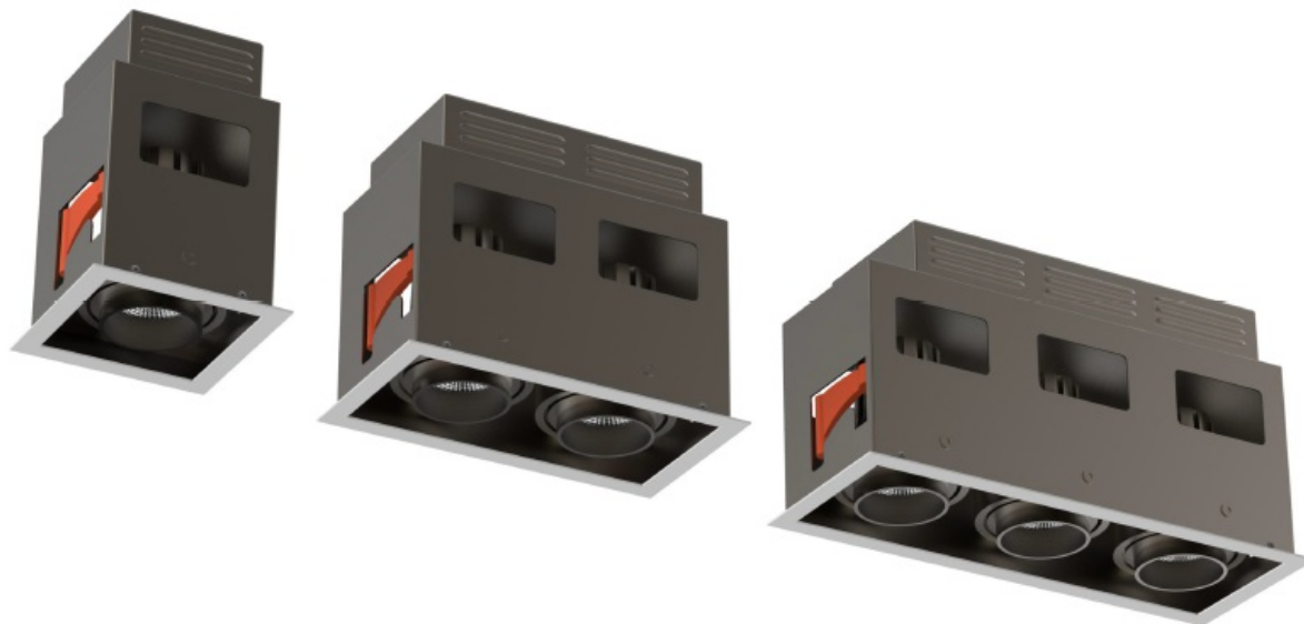
Photo de mise en situation