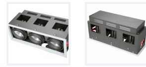
Photo(s) non contractuelle(s). L'apparence du produit peut être amenée à être modifiée.