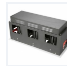
Photo(s) non contractuelle(s). L'apparence du produit peut être amenée à être modifiée.