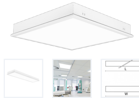
Photo(s) non contractuelle(s). L'apparence du produit peut être amenée à être modifiée.