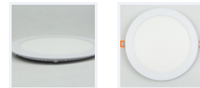
Photo(s) non contractuelle(s). L'apparence du produit peut être amenée à être modifiée.