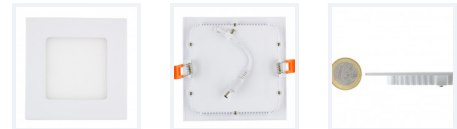
Photo(s) non contractuelle(s). L'apparence du produit peut être amenée à être modifiée.