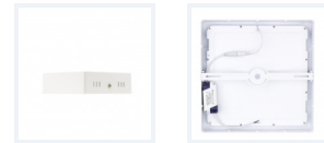
Photo(s) non contractuelle(s). L'apparence du produit peut être amenée à être modifiée.