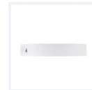
Photo(s) non contractuelle(s). L'apparence du produit peut être amenée à être modifiée.