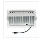
Photo(s) non contractuelle(s). L'apparence du produit peut être amenée à être modifiée.