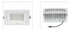
Photo(s) non contractuelle(s). L'apparence du produit peut être amenée à être modifiée.