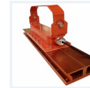
Photo(s) non contractuelle(s). L'apparence du produit peut être amenée à être modifiée.