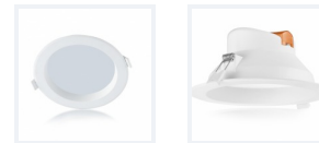
Photo(s) non contractuelle(s). L'apparence du produit peut être amenée à être modifiée.