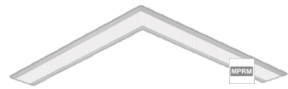
Photo(s) non contractuelle(s). L'apparence du produit peut être amenée à être modifiée.